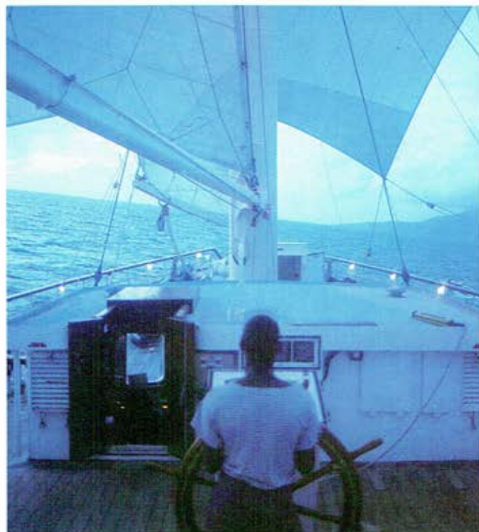
Bij het invallen van de schemering worden de zeilen gehesen (rechts) en zet de Star Flyer koers naar een nieuw eiland in de Caraïbische archipel

B ollende zeilen tegen de achtergrond van een heldere sterrenhemel. Kapitein Geoff Walker van de Star Flyer tuurt op het kompas en geeft aanwijzingen aan zijn stuurman. De nacht is warm en aan bakboord zijn de donkere contouren van een eiland te ontwaren. Zo moet het vijf eeuwen geleden ook Columbus zijn